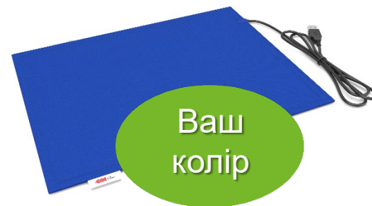
Виготовлення килимка в корпоративних кольорах замовника