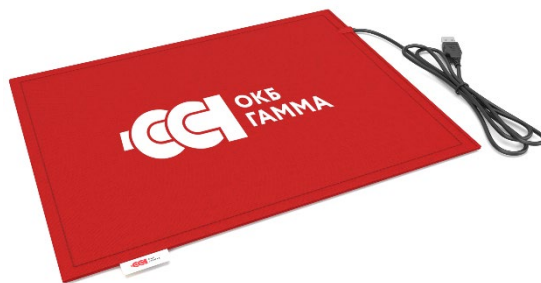
Нанесення на килимок логотипу замовника