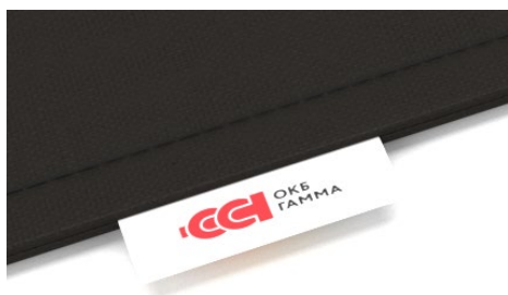
Вшивний ярлик з логотипом замовника